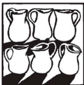
Grafik: Bergmoser + Höller Verlag, Aachen

Er gönnt uns unsere Feste; in ihnen kosten wir bereits einen Vorgeschmack auf mehr und ahnen das Verschwenderische, was Gottes Stil ist. Wir dürfen vorkosten und haben hoffentlich unseren Durst nach Gott nicht verloren. Gott bringe das Fass der Gnade zum Überlaufen.